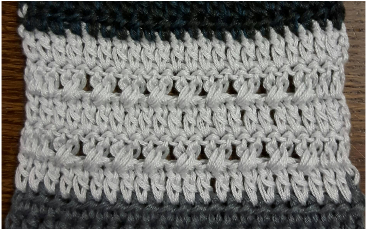
November Muster in Reihen

Musterfolge: Reihe 1 und 2 siebenmal häkeln, Reihe 1 einmal wiederholen.