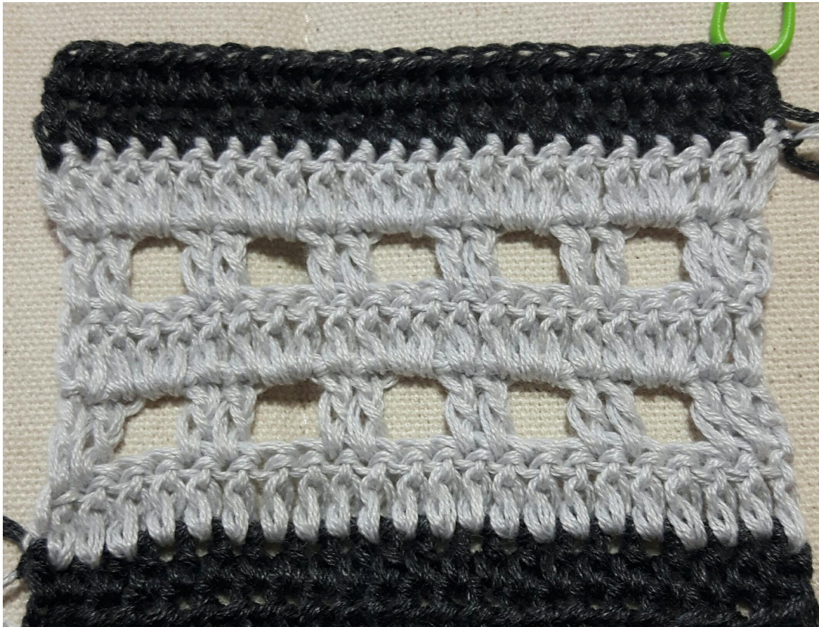
Februar Muster in Reihen

3/3 Die Anleitung ist für Lady Dee's Traumgarne, sie darf nicht auf anderen Seiten verkauft werden und nicht in anderen Gruppen geteilt werden. Eine kommerzielle Nutzung der Anleitung ist untersagt! Der Inhalt darf nicht geändert und/oder Teile daraus verwendet werden. Der Hinweis auf Urheberschaft darf nicht entfernt werden. Die Texte und Bilder unterliegen dem Copyright des Autors. Ursula Deppe-Krieger für LADY DEE'S TRAUMGARNE Februar 2018