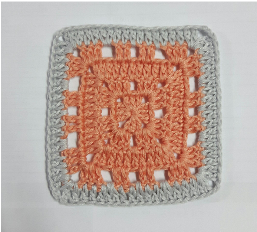
Februar Muster als Granny