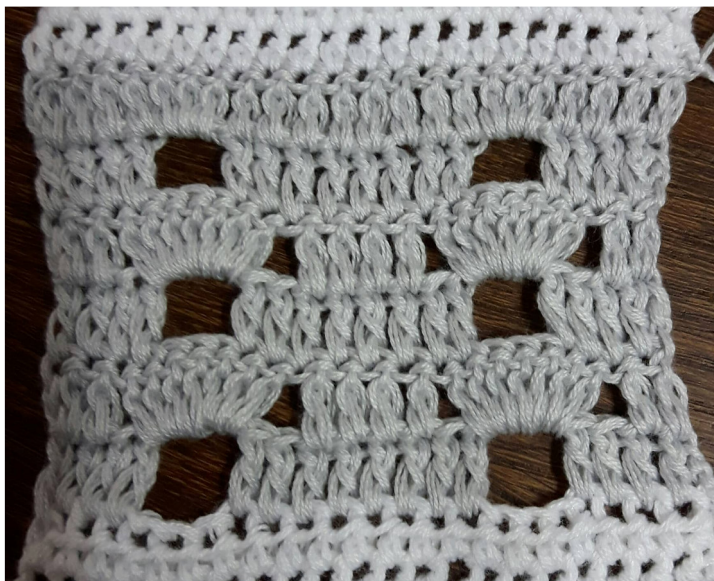
Dezember Muster in Reihen

Musterfolge: Reihe 1 bis 3 einmal häkeln, Reihe 2 und 3 fünfmal wiederholen. Reihe 4 einmal häkeln.