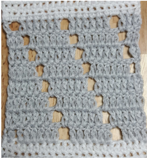
September Muster in Reihen (zeigt meinen Ausschnitt mit 22 Maschen)

4/4 Die Anleitung ist für Lady Dee's Traumgarne, sie darf nicht auf anderen Seiten verkauft werden und nicht in anderen Gruppen geteilt werden. Eine kommerzielle Nutzung der Anleitung ist untersagt! Der Inhalt darf nicht geändert und/oder Teile daraus verwendet werden. Der Hinweis auf Urheberschaft darf nicht entfernt werden. Die Texte und Bilder unterliegen dem Copyright des Autors. Ursula Deppe-Krieger für LADY DEE'S TRAUMGARNE August 2018